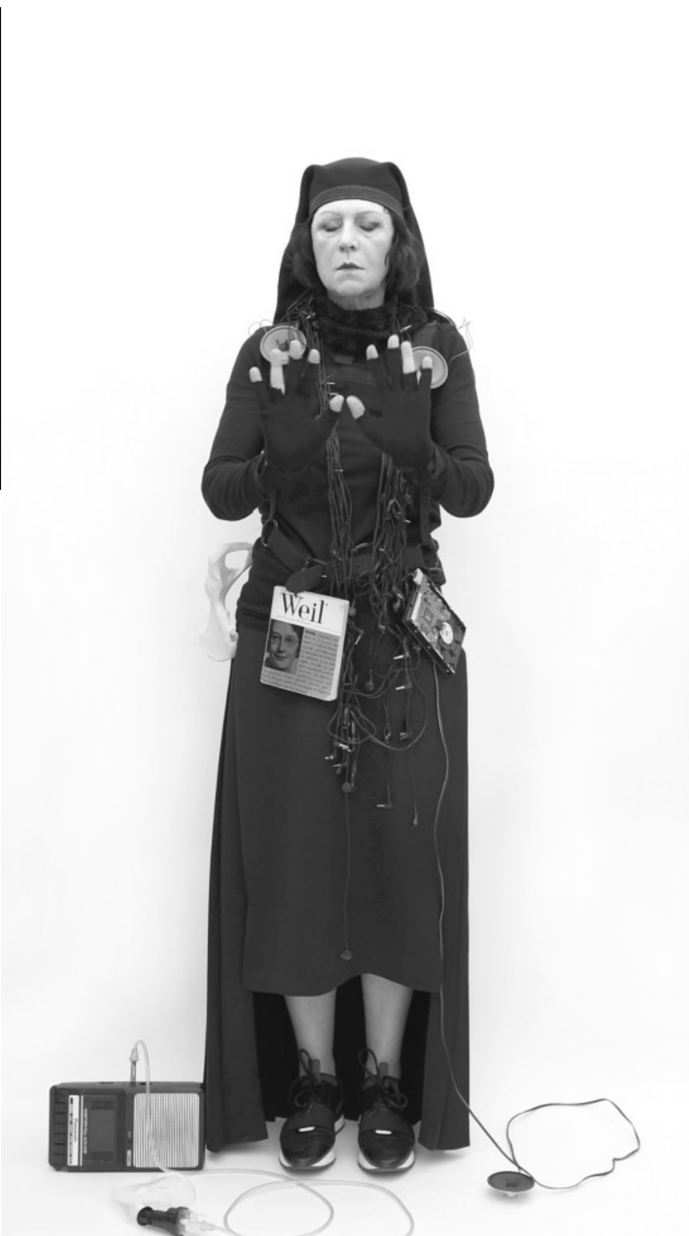
Performance (do.space). © daniel van acker. 2022